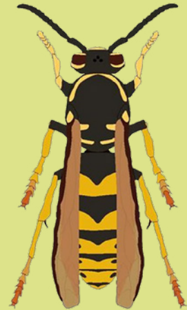
Gemeine Wespe ( Vespula vulgaris )