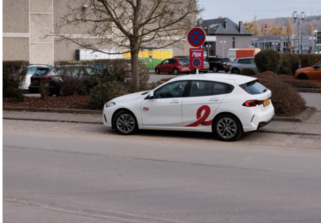
Bereldange – Rue X-Octobre