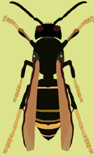
Asiatische Hornisse ( Vespa velutina )