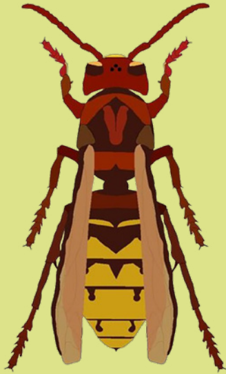
Europäische Hornisse ( Vespa crabro )