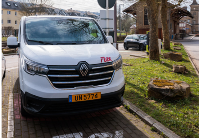
Walferdange – Gare