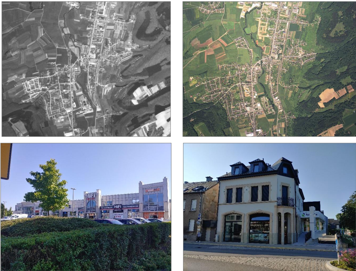
Abbildung 1 Landwirtschaftliche Nutzflächen in der Gemeinde Walferdange 1977 (links oben) und 1994 (rechts oben) sowie Geschäfte in der „Route de Luxembourg“ (unten links) und der „Route de Diekirch“ (unten rechts). Quelle: geoportail.lu 2023 (oben) | CO3 2021 (unten)

Die Gemeinde Walferdange liegt im Alzettetal, ist Teil des nördlichen Agglomerationsraums der Hauptstadt Luxemburg und wird maßgeblich von dessen dynamischem Wirtschaftswachstum mitgeprägt. Zwar wurden in den 1970er Jahren in Walferdange in und direkt angrenzend an die Stadtteile Flächen landwirtschaftlich genutzt, aber aufgrund der Nähe zur Stadt Luxemburg nahm die Landwirtschaft schon damals eine geringere Stellung als in anderen Gebieten des Landes ein. Seit den 1990er Jahren ist die Landwirtschaft fast vollständig aus dem Stadtbild verschwunden (nur noch 1 aktiver Bauernhof) und es fand eine Tertiärisierung der Wirtschaft statt. Dies spiegelt sich auch im Stadtbild, und insbesondere entlang der Hauptverkehrsachsen, durch eine Nutzung des Erdgeschosses mit einem Dienstleistungsunternehmen wider.