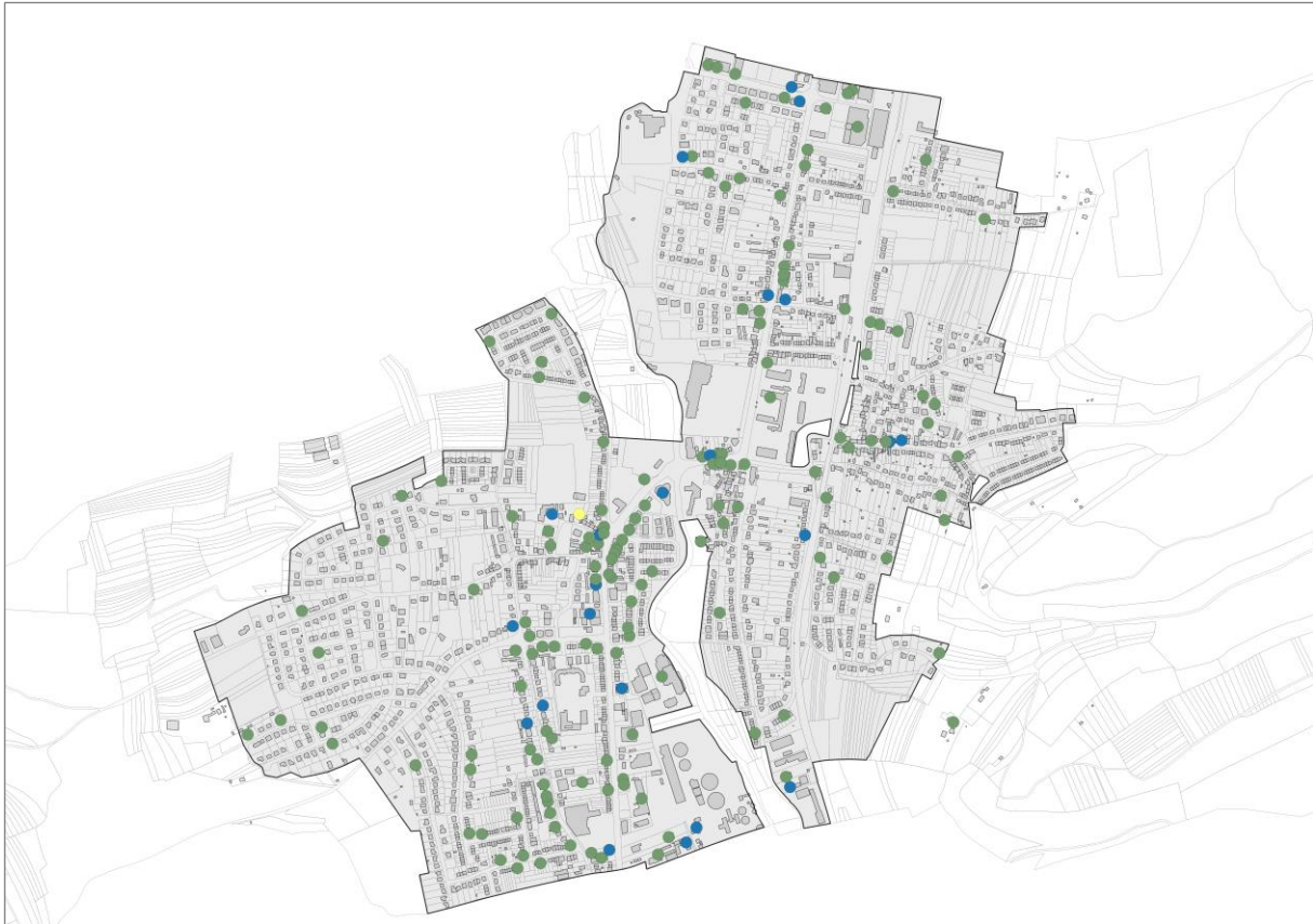
Abbildung 4 Unternehmensstandorte in der Gemeinde Walferdange (gelb = Unternehmen des primären Sektors | blau = Unternehmen des sekundären Sektors | grün = Unternehmen des tertiären Sektors).